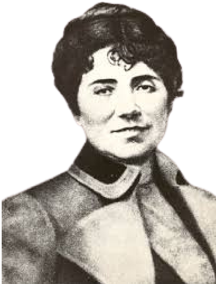
Rosalía de Castro

Amoriñas das silveiras que eu lle daba ó meu amor, camiñiños antre o millo, ¡adiós para sempre adiós!"