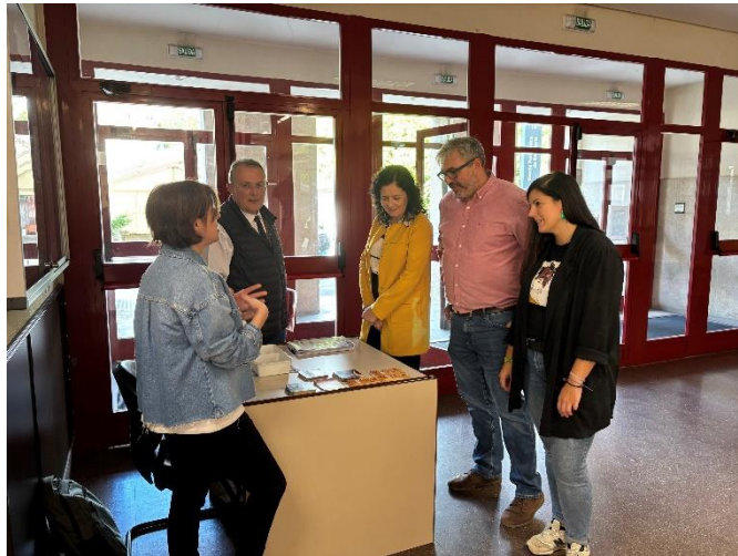
EPEF, 3 de Outubro, día nacional das universidades saudables, stand infodrogas ASFEDRO.

Vicerreitoría do Campus de Ferrol e Responsabilidade Social