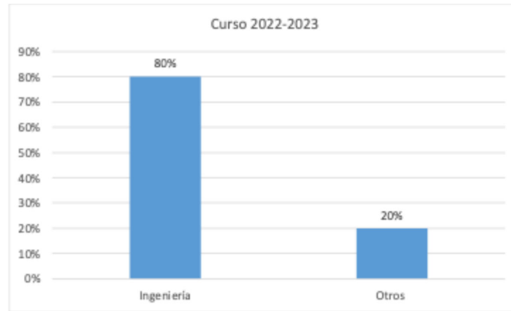
Figura 58. Sectores en que trabajan los egresados del Máster en Eficiencia Energética y Sostenibilidad del curso 2022-2023.