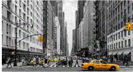
Beca Arquia NY