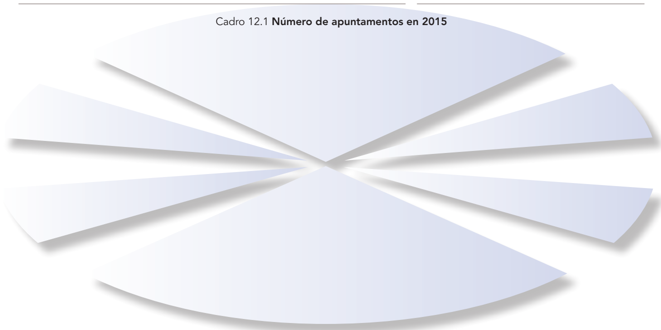
Cadro 12.1 Número de apuntamentos en 2015