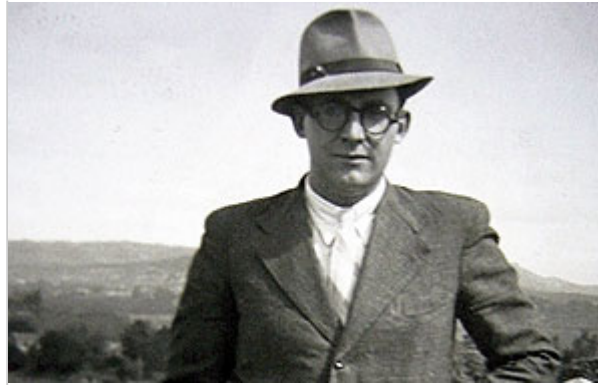
Álvarez Blázquez nunha fotografía dos anos trinta do século XX pertencente ao arquivo familiar

A exposición elaborada por alumnos e profesores do Instituto Armando Cotarelo Valledor, situado na localidade pontevedresa de Vilagarcía de Arousa, percorrerá 2.500 centros galegos e de todo o mundo para ilustrar a figura de Xosé María Álvarez Blázquez, a quen este ano se lle dedica o Día das Letras Galegas.