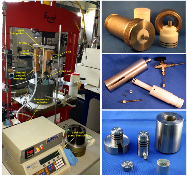
A: Izquierda; Dispositivo experimental diseñado para estudiar la consolidación de arenas a altas temperaturas y presiones en presencia o ausencia de fluido intersticial. Derecha: Distintos elementos fabricados ex profeso para el estudio de la consolidación de arenas a altas presiones y temperaturas: Arriba: cilindro de transferencia de PTFE con pistón flotante; Centro: Jeringa de PTFE para muestreo de líquidos a alta P. Abajo: Edómetro de alta presión y porta muestras

Los ensayos, de diverso tipo (B), se desarrollaron de forma continua durante varias semanas, con un amplio registro experimental (C).