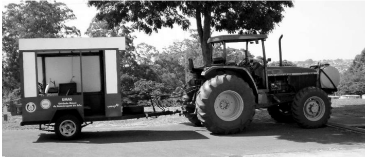
Fig.1. Vista general de la UMAS traccionada por un tractor.

donde quedan registrados los valores de fuerza, obtenidos a través de una célula de carga, conforme ASAE S313.2 (1999) y los datos correspondientes a su profundidad de penetración son generados por un potenciómetro.