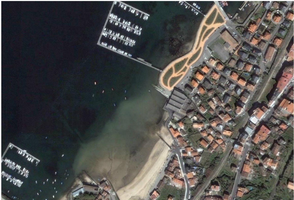
VISTA AEREA DE LA ZONA DE ACTUACIÓN