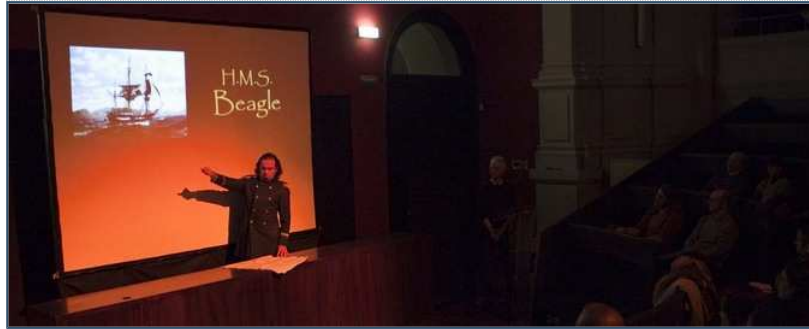
Bienvenidos a un viaje a bordo del 'Beagle'. CARLOS MUÑOZ