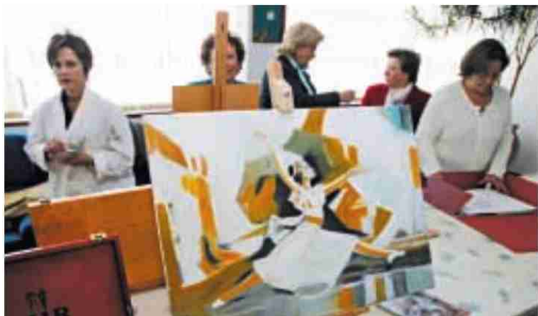
Affamer arrancó ayer con su curso de pintura en el centro social lalinense | M. S.