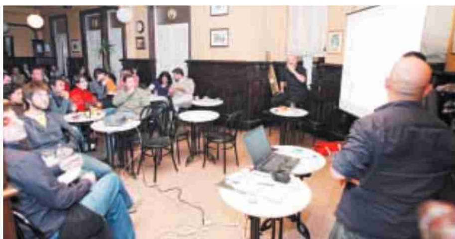
A Farola de A Estrada acogió anoche un café científico del colectivo Neurocom

den acudir a las 16.00 horas de hoy al cásting infantil, que será una hora después. Por cierto, que los asistentes tendrán una entrada para acudir, a las 18.30 horas, al pase de la película El patito feo , en el día de su estreno