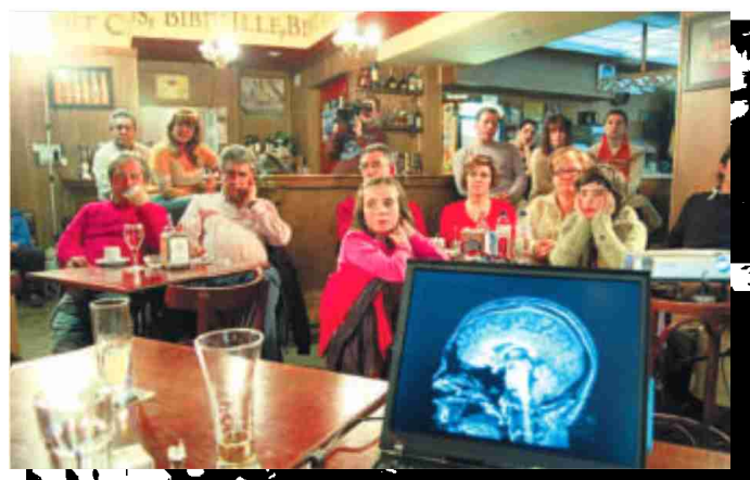
Un aspecto del café científico celebrado en Moaña.

pues con visitas a locales de otras villas, como Foz o Moaña. "Cuando la muestra llegaba a uno de esos pueblos, hablábamos con el dueño de un bar y montábamos una charla debate", recuerda Xurxo Mariño. El método es tan llamativo como efectivo: ante la sorpresa de los clientes, los científicos invitan a una ronda gratis y muestran una serie de juegos visuales a través de un ordenador. "La gente no se cree la ilusión óptica que les estamos enseñando -añade- y piensa que tratamos de engañarlos: es el cerebro el que nos engaña a todos, todos los días, pero muchos paisanos no se lo creen. A continuación, una vez que la gente se ha enganchado al tema, iniciamos nuestra charla y después resolvemos las dudas que puedan plantearse", añade Mariño, que se muestra encantado con el resultado de esta iniciativa pues consigue acercar la ciencia a la