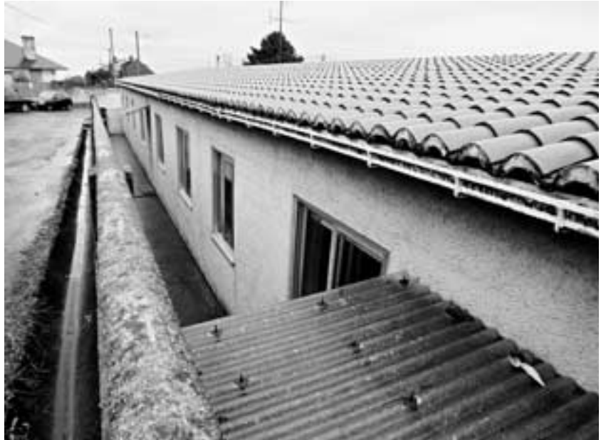
Un estudio de Arquitectura desveló la existencia de un centenar de infraviviendas cerca de los campus